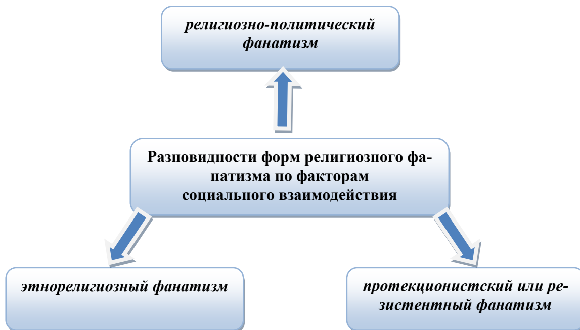
Рис.2. Разновидности форм религиозного фанатизма по факторам социального взаимодействия (авторская концепция).

В зависимости от количественного состава, идеологических и стратегических различий религиозные организации имеют большее или меньшее влияние на политику государства. Если степень влияния настолько высока, что она оказывает давление на законодательную власть и формирование политики государства в целом, и при этом существует явное ущемление прав других граждан, либо религиозных организаций, то это может привести к вспышкам религиозно-политического фанатизма .