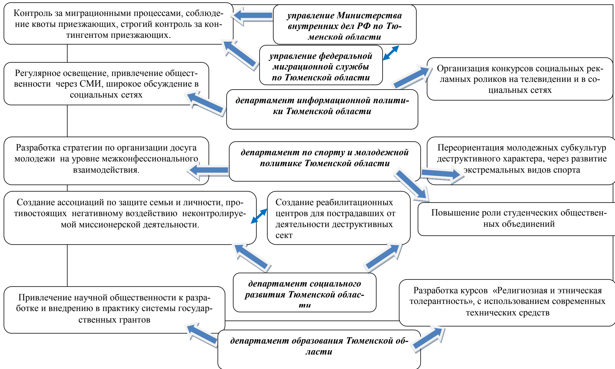
Рис. 4 Комплекс социально направленных мероприятий по профилактике религиозного фанатизма и экстремизма в Тюменской области.