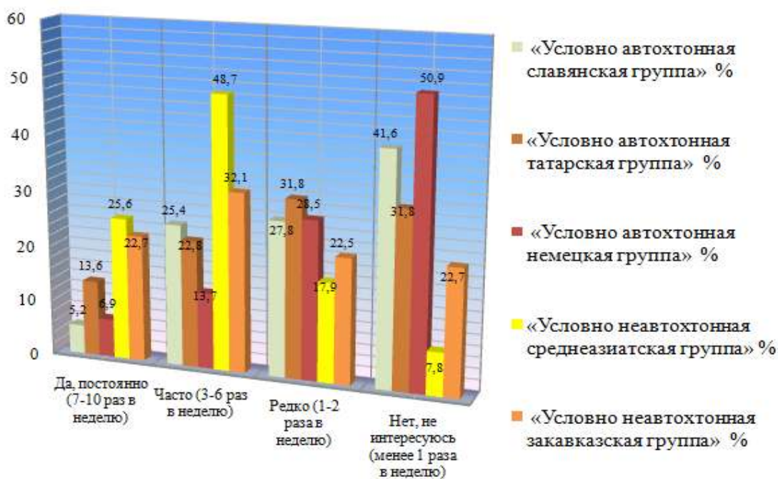
Рис. 1. Степень интереса жителей г. Новосибирска к этнокультурному разнообразию, % (распределение ответов на вопрос: «Интересуетесь ли Вы информацией о национальных культурах?»)

Результаты социологического исследования показывают, что 6,7% респондентов ответили, что испытывают интерес к информации о различных этнических культурах: 26,2% – часто; 26,7% – редко и 40,4% не интересуются данной информацией. Следует отметить, что у представителей среднеазиатской и закавказской «условно неавтохтонных групп» наблюдается повышенный интерес к информации о инокультурности, что связано, как правило, с потребностью данных представителей адаптироваться в принимающем, доминирующем социуме. Альтернативная реакция на информацию о различных культурах наблюдается среди «условно автохтонных групп», которые можно считать мажоритарными, у них фиксируется низкая степень интереса к подобной информации (Рис. 1).