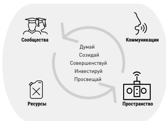
Системообразующие элементы трансляции ценностей

Трансляция ценностей в вузе должна быть основана на: