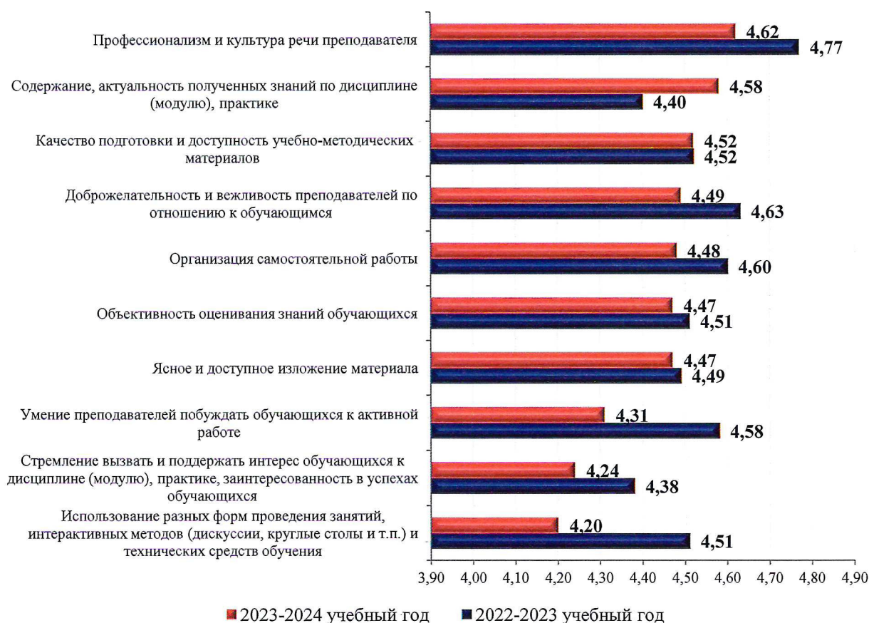
Рисунок 3 – Средние баллы по критериям, характеризующим профессиональную деятельность учителей общеобразовательного лица по результатам 2023-2024 учебного года

Средние баллы по каждому критерию, характеризующему профессиональную деятельность учителей общеобразовательного лица в 2023-2024 учебном году, представлены на рисунке 3.