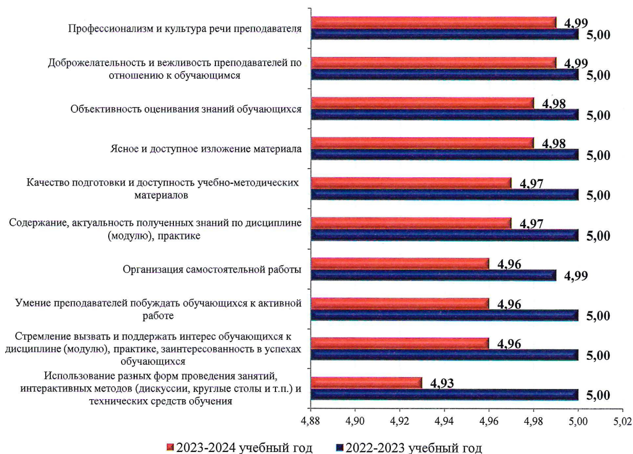
Рисунок 1 – Средние баллы по критериям, характеризующим профессиональную деятельность преподавателей ВО, входящих в рейтинг «ТОП-50» преподавателей университета, получивших самые высокие баллы

Сведения об оценках преподавателей учебных структурных подразделений и кафедр, реализующих программы ВО, представлены в приложениях 3, 4.