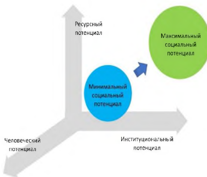
Рисунок 4 - Схема формирования образов социального потенциала АЗ РФ в геометрическом пространстве его составляющих

Объектами социальных экспериментов на виртуальном пространстве являются уровни социального потенциала, которые определяется набором социальных и экономических показателей, агрегированных в индексы. В процессе проведения экспериментов на полигоне изменяется содержание наборов различных социальных, экономических, экологических и социокультурных показателей (индексов) для того, чтобы проследить тенденции изменения других показателей (индексов) и обозначить набор оптимальных изменений для выявления наиболее эффективного и оптимального социального потенциала северных территорий (максимизация всех индексов). На первом этапе определяются индексы, подлежащие изменению, на втором – они изменяются, на третьем выявляются произошедшие по результатам второго этапа изменения с другими индексами. На четвертом этапе экспериментирования разрабатываются способы формирования различных уровней социального потенциала от самого низкого до высокого в имеющихся условиях жизнедеятельности северных территорий (рисунок 4). Так происходит постановка управленческой задачи на полигоне.