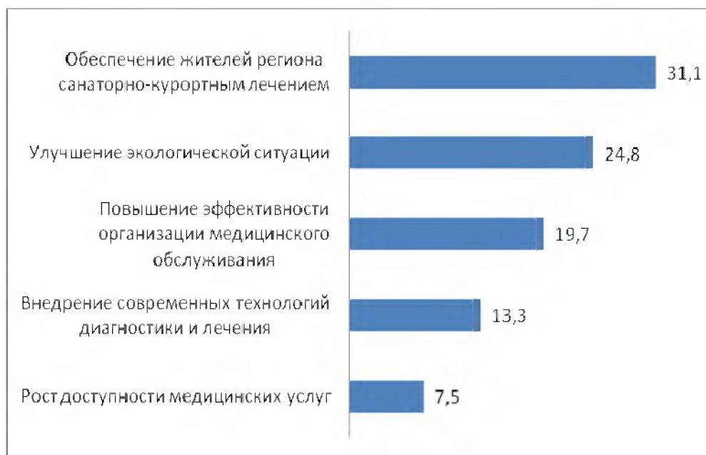
Рисунок 3 - Факторы сохранности здоровья

Таким образом, требуют приоритетного решения проблемы привлечения квалифицированного медицинского персонала и разработки здоровьесохраняющих технологий, направленных на улучшение экологической ситуации в регионе, качества питьевой воды, уменьшение вредных выбросов в атмосферу, использование экологически безопасного оборудования и т.п.