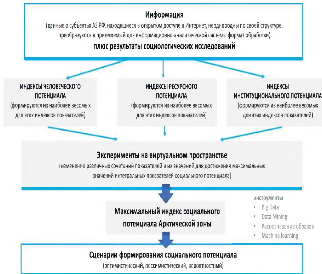
Рисунок 5 - Обработка и анализ информации при формировании социального потенциала Арктической зоны РФ

Таким образом, на создаваемом информационно-социологическом полигоне в виртуальном пространстве проводятся эксперименты по моделированию, прогнозированию и повышению эффективности постановки и принятия управленческих решений (рисунок 5).