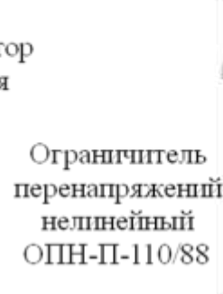
Ограничитель перенапряжений нелинейный ОПН-П-110/88