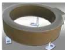
Трансформатор тока ТВ-110